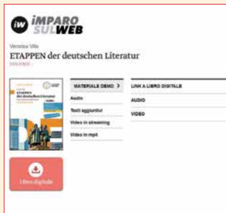
Ecco che cosa vedi in Imparusulweb.

Entra nella libreria di MybSmart facendo login con il tuo account Imparusulweb e clicca sulla copertina del libro attivato per scaricarlo. Sfoglia le pagine e i pulsanti ti guideranno alla scoperta delle risorse multimediali collegate.