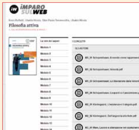
Ecco che cosa vedi in Imparusulweb.

Entra nella libreria di myLIM facendo login con il tuo account Imparusulweb e clicca sulla copertina del libro attivato per scaricarlo. Sfoglia le pagine e i pulsanti ti guideranno alla scoperta delle risorse multimediali collegate.