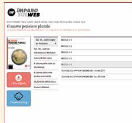
Ecco che cosa vedi in Imparusulweb.

Entra nella libreria di myLIM facendo login con il tuo account Imparusulweb e clicca sulla copertina del libro attivato per scaricarlo. Sfoglia le pagine e i pulsanti ti guideranno alla scoperta delle risorse multimediali collegate.