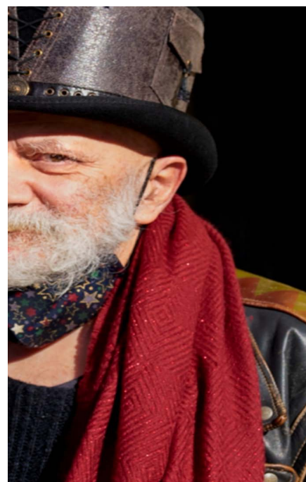
regiata esperienza nella didattica dell'italiano.