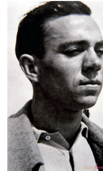
Miguel Hernández (1910-42)

Nació en Orihuela (Alicante) de una familia humilde, por lo que tuvo que dejar pronto la escuela. Su fuente de formación será la lectura de la poesía clásica española.